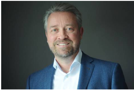
Abteilungsleiter Regionaleinkauf Berlin / Brandenburg, Sachsen-Anhalt EDEKA Handelsgesellschaft Minden-Hannover mbH